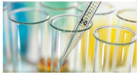
合亚医药科技(上海)有限公司 Acme Biopharma Co., Ltd.

Integrity, accountability, teamwork, and excellence form the foundation of our core values and future success